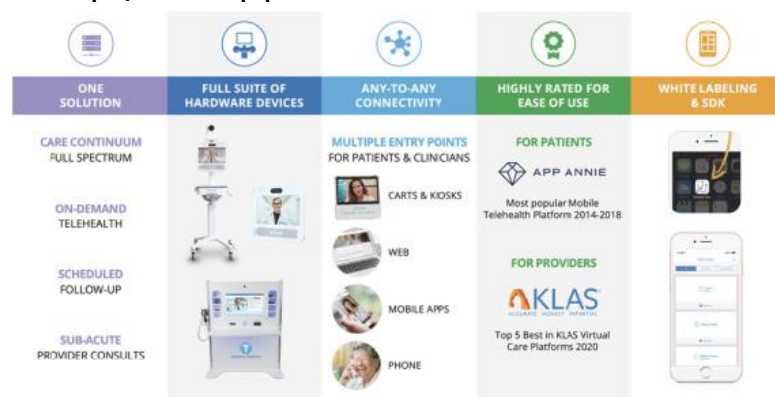
Иллюстрация 1. Платформа Amwell

Сама платформа предоставляет возможность оказания всего ряда медицинских услуг - от первичной неотложной помощи на дому до специализированных консультаций.